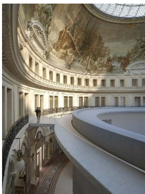
Bourse de Commerce

Vi flyger från Stockholm kl. 12.45 med ankomst till Paris kl. 15.30 där vi möts på flygplatsen av vår buss som tar oss till Hotel Trianon Rive Gauche, ett fyrstjärnigt hotell med utmärkt läge intill Luxembourgträdgården. Efter incheckning samlas vi på kvällen för en gemensam välkomstmiddag.